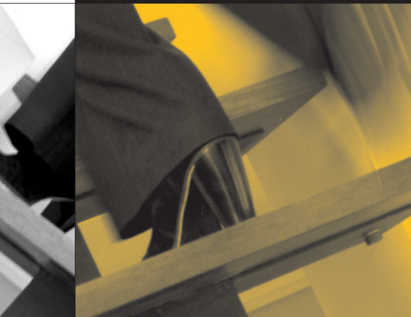
∨ GRACIA VIOLETA ∨ ROSS QUIROGA